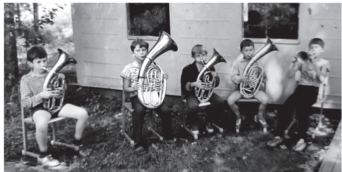
«Горный» – труба зовет! Юные духовики на репетиции, 1988 год.

Время от времени звучат предложения о передаче лагеря в ведение региона – для увеличения финансирования. Но в таком случае Железнодорожскому достанется примерно 20% путевок, а это существенная потеря для детского оздоровления. Надеемся на лучшее, ведь «Горный» – это наше достояние, которое город должен сберечь.